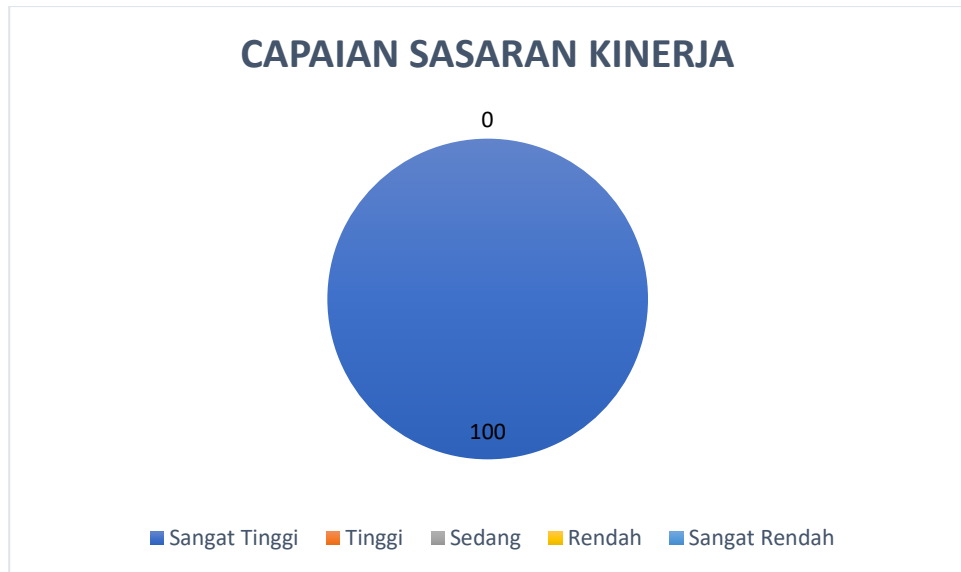
Gambar 2 Diagram Capaian Sasaran Kinerja