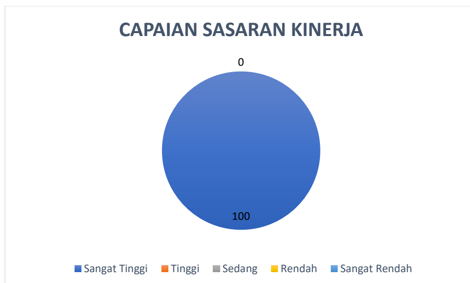
Gambar 2 Diagram Capaian Sasaran Kinerja